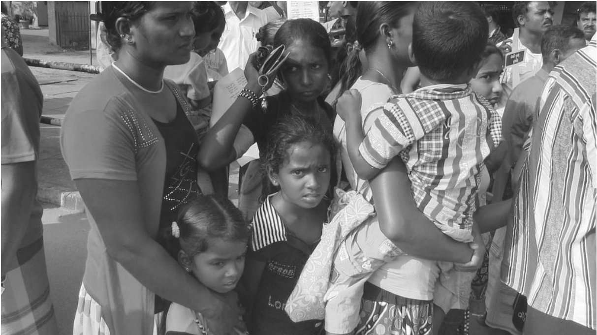
2014 පෙබරවාරි 15 - සමරු රැස්වීමට ධීවර ජන පවුල් දරුවන්ගේ ද සමඟ එක්වූයේ සාමකාමී විරෝධතාවයක යෙදීමටය.

මෙලෙස සිවිල් ඇඳුමින් සැරසුණු කණ්ඩායමක් යෙදවීම පිළිබඳව සංවිධායකවරු විරෝධය පළ කරන විට හලාවත ජ්‍යෙෂ්ඨ පොලිස් අධිකාරීවරයා සංවිධායකයන්ට බලපෑම් කරමින් කියා සිටියේ අදාළ උද්ඝෝෂණය නවතා දැමිය යුතු බවයි. 23